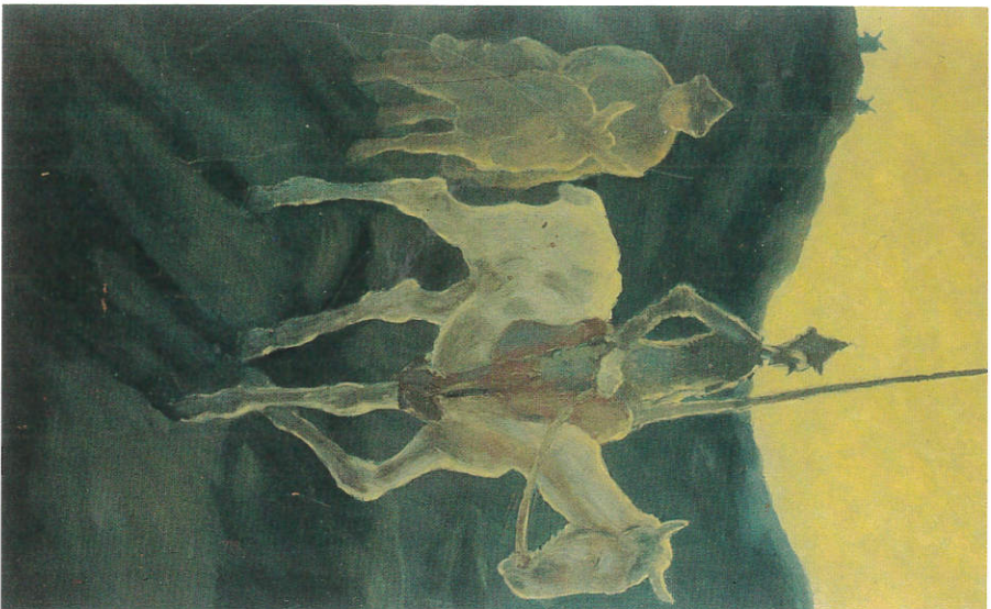
Martin A. Hansen: Don Quijote

Motivet er malet på en skydedør ved indflytningen i Skolevængen 21, Brønshøj, 1940. Skydedøren blev taget med til "Salum" i 1950 og brugt som loft over en gæsteseng, bygget af Martin A. Hansen.